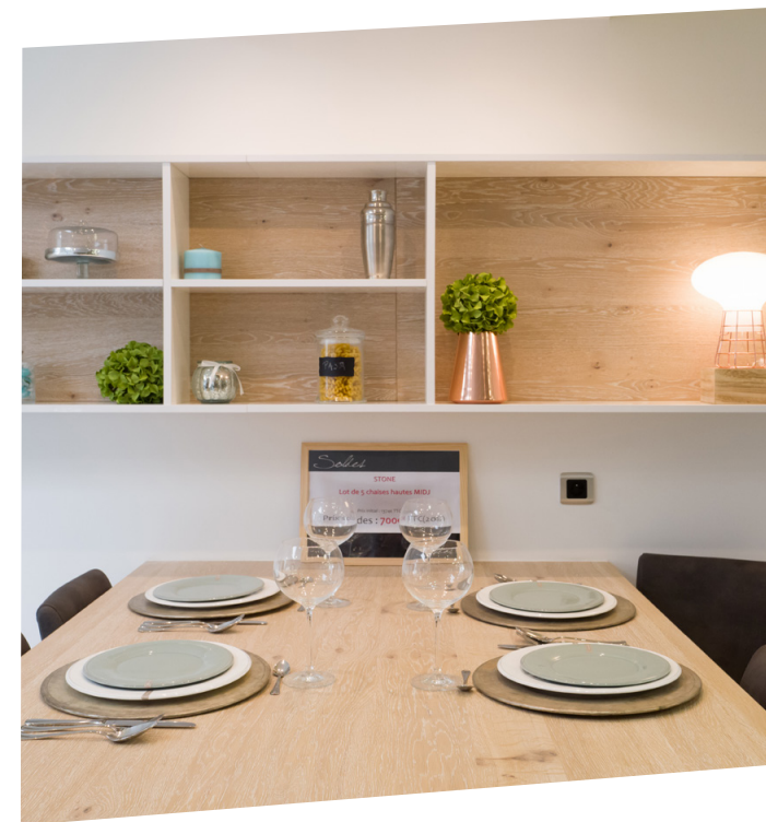
Eva Ponthieu, diplômée 2010 a ouvert son magasin de cuisines de luxe HERVA à Valenciennes

La licence MEM ouvre une section par apprentissage à la rentrée 2017.